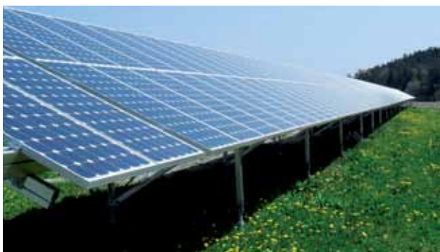
1 MW, Wirbenz, Allemagne

Les modules de Jetion sont utilisés partout où l'efficacité économique à long terme, la fiabilité et les questions environnementales sont de grande importance.